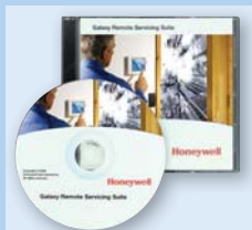
Remote Service Suite (RSS, Softwarepakket voor service op afstand) User Management Suite (UMS, Softwarepakket voor gebruikersbeheer)